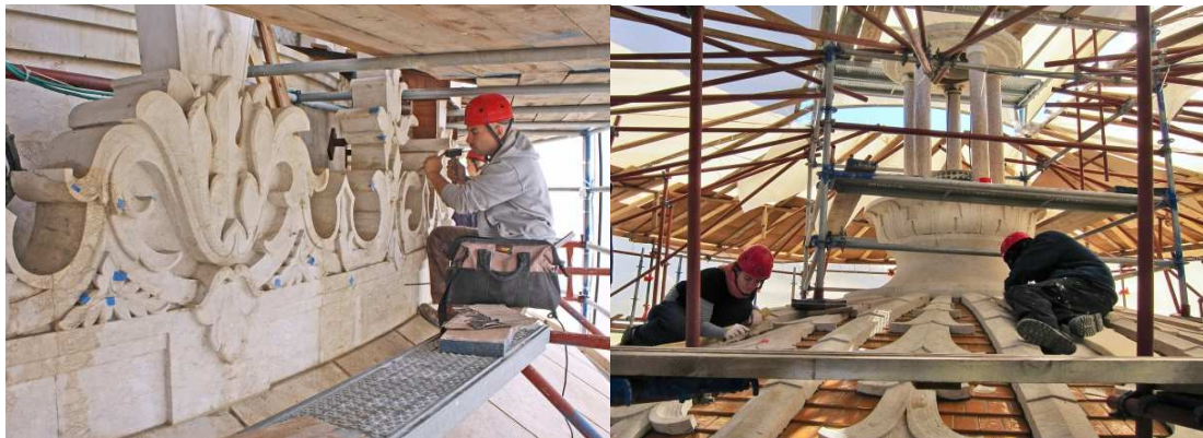
بازسازی و تعمیرات سریع مقام اعلی 2