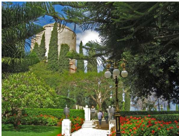
نمای خارجی بنای شکوهمند مقام اعلی در دست ترمیم و بازسازی